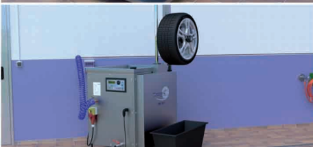
Abbildung zeigt Waschmaschine mit zusätzlichen Optionen